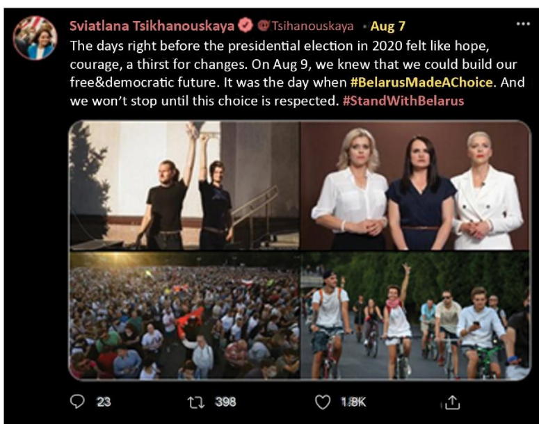
Рис. 4: Твит Светланы Тихановской от 7 августа.

Свежим примером захватывающей политической истории с высокими ставками, яркими характерами и сюжетом стала история белорусского лидера в изгнании Светланы Тихановской. В 2020 г. Тихановская баллотировалась в президенты «по любви»—после того, как её мужа арестовали за такие планы—чтобы вызволить его из тюрьмы. Проиграв официальное голосование, Тихановская бежала в Литву, чтобы заручиться поддержкой, как законный лидер Беларуси в изгнании. В Европе и странах НАТО её восприняли как селебрити, возможно, отчасти потому, что её история возродила классический комедийный (но не смешной) сюжет, восходящий к римскому периоду, где отважные молодые люди борются с угасающим старым тираном, чтобы построить мир, в котором они смогут свободно любить.