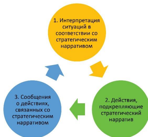
Рис. 2: Три модели использования эффекта нарративов.