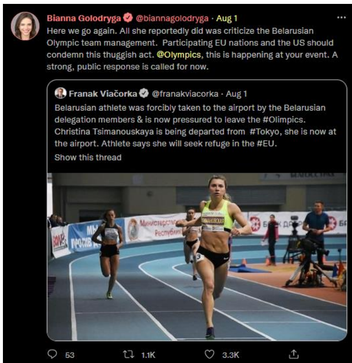
Рис. 6: Твит журналистки CN Бианны Голодрыги, позаимствованный из твиттера старшего советника Светланы Тихановской, о преследовании белорусским режимом участницы Олимпийских игр, спринтера Кристины Тимановской, 1 августа 2021 г.

Но понимание нарративов, которое нужно в первую очередь усвоить военным институтам, заключается в том, как в целом подаётся применение силы. Командиры, планирующие операции, должны понимать, что истории, которые расскажут об их действиях, повлияют на гораздо больше людей, чем их оружие. Операторы должны понимать, что злоумышленники неизбежно будут использовать ошибки в их действиях. Коммуникаторам нужно понимать, что интересный сюжет, узнаваемые персонажи и простой язык нравятся всем. Напротив, посты, посвященные снаряжению и написанные жаргоном, не затронут почти никого, кроме самой организации, усиливая культурную изоляцию, вместо того, чтобы искать выход за её пределы для продвижения военных ценностей. В «старую-новую» эпоху нарративов никто не откажется рассказать свою историю или узнать историю, которую могут рассказать о нём.