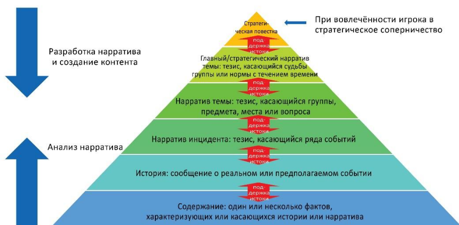
Рис. 1: Модель анализа и конструирования нарратива.

Хорошей новостью является то, что разрабатываются инструменты на основе искусственного интеллекта, которые смогут находить и группировать нарративы в традиционных СМИ и соцсетях по общим темам, а также настроениям, которые они отражают, и соцсетям, где они популярны. 13 Структурируя большие объёмы данных публичного информационного пространства, такие инструменты могут помочь военным понять картину нарративов и свою действенную роль в ней. 14 Мы предлагаем использовать пирамидальную модель нарратива, показывающую, что происходит с данными историй, обсуждаемых в разных группах, чтобы облегчить общее понимание предпочтительных нарративов по различным темам и лежащим в их основе главным нарративам, структурирующим их мнения.