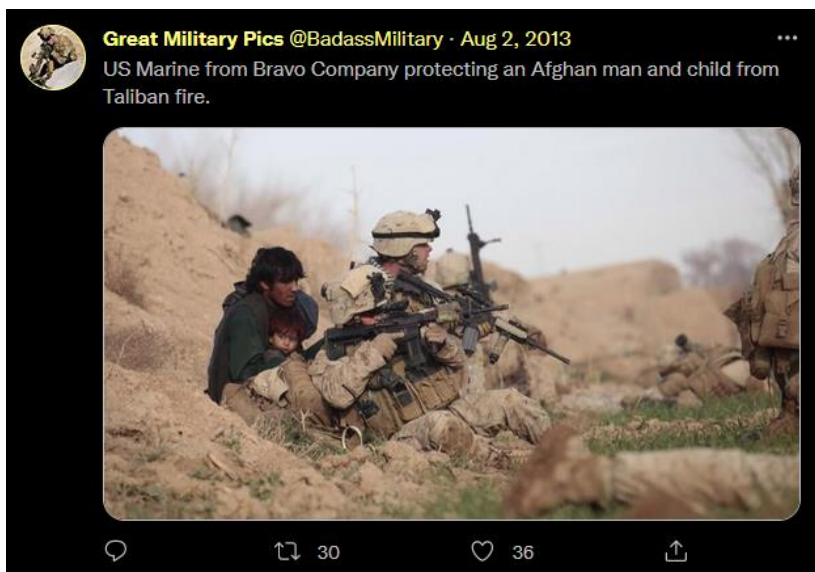
Рис. 3:

Все эти характеристики иллюстрирует следующее фото, удачно найденное в твиттере «Great Military Pics». На фото явно присутствует Сюжет – отражение угрозы; Архетип защитника невинных; Образность в использовании оружия как рубежа «между двух огней»; и Ценности безопасности и отсутствия террора. Хотя не каждый военный твит столь драматичен, тут мы видим пример медийной реакции и запоминающегося контраста, к которому следует стремиться военным в своих историях.